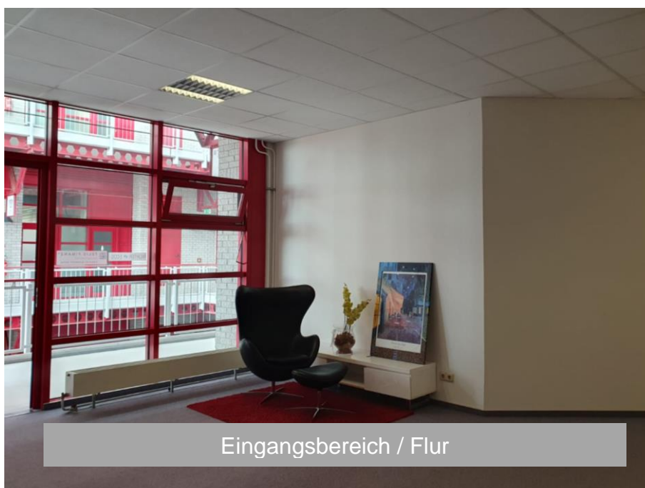
Eingangsbereich / Flur