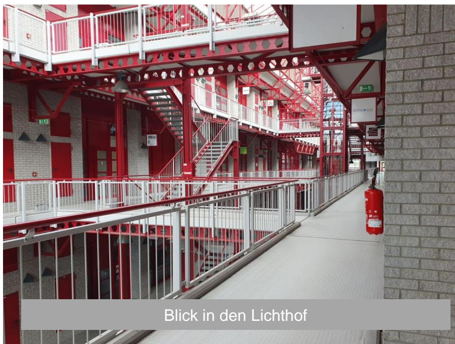
Blick in den Lichthof